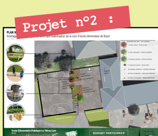
Projet n°2 :