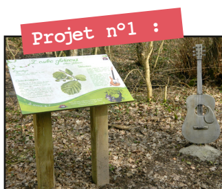
Projet n°1 :